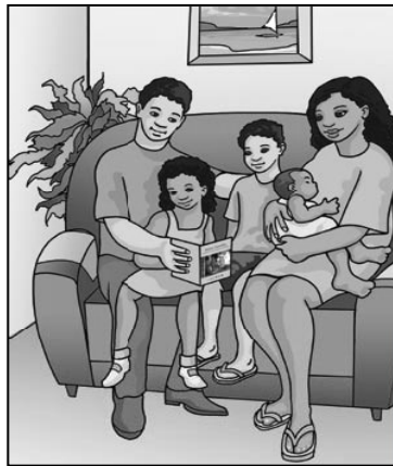
Figura 2 – Família da cartilha Agenda de compromissos

Tais imagens não correspondem à realidade, especialmente nas classes mais pobres. Sabe-se que hoje existem novos arranjos familiares (VITALE, 2002; ACOSTA & VITALE, 2003, CARVALHO, 2003) e cresce o número de famílias monoparentais, chefiadas mulheres – e esse era o perfil predominante no cadastro de Cariacica (SOBRINHO, 2006). Ou seja, a despeito da crescente centralidade da família na política social, os programas de transferência de renda nem sempre consideram as mudanças ocorridas no mundo familiar: os novos arranjos, a perda da identidade com os processos de migração, os mecanismos de resistência das famílias empobrecidas, sua articulação em redes, valores, crenças e lutas.